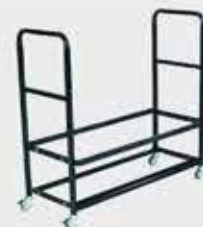
Chariot de 12 à 24 chaises (selon les modèles)