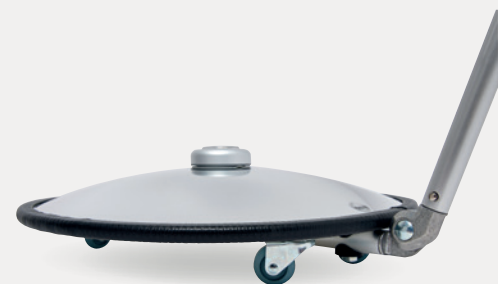
Vumax 322 R : monté sur roulettes orientables