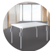
Mairietable RECTANGLE p.14