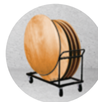
Chariot TRD p.19