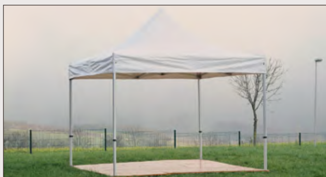
Référence plancher complet 4x4 : MOB898N