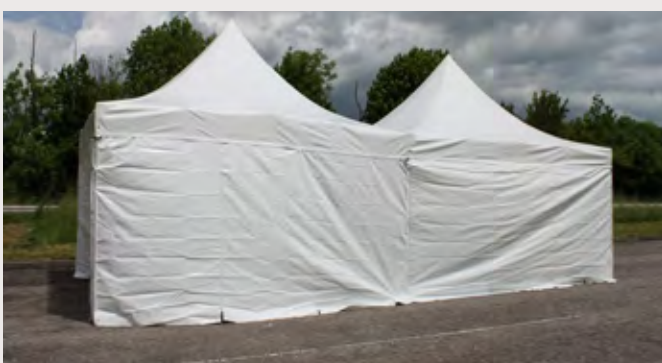
M/Y031P64 > RIDEAU BLANC 5M RIDEAU PLEIN BLANC, entoilage 450 gr/m 2 Classification antiFeu M2 - PVC anti UV