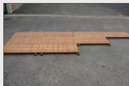
Planchers pour pose au sol

Ossature > Tri-plies pose au sol « gros tasseaux »