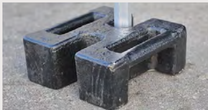
M/DIV1007L > 30 kg Poids de lestage fonte 30 kg