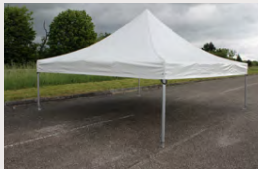
M/A789T03 >Toit, armature, housse, kit haubanage