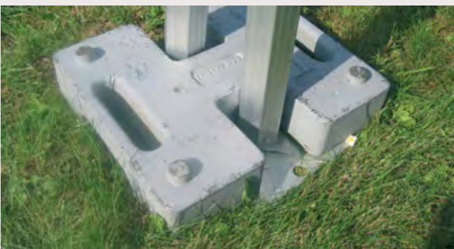
M/DIV1038W > 295 mm x 255 mm, ERGO 72x92 mm Poids de lestage fonte 20 kg