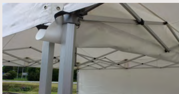
M/Y031A80 > GOUTIÈRE 5M Gouttière à mettre entre 2 stands pour l'étanchéité entoilage 450 gr/m 2 , Classification antiFeu M2 - PVC anti UV