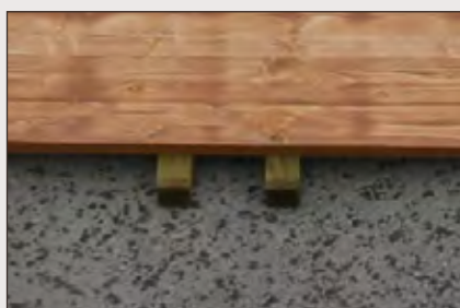
Tasseaux 45x45 mm