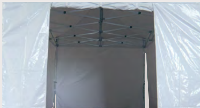
M/Y031A69 > RIDEAU PORTE BLANC 5M Rideau avec porte de 2m, ouverture à glissière, entoilage 450 gr/m 2 , Classification antiFeu M2 - PVC anti UV