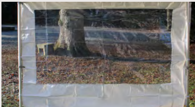
M/Y031R76 > RIDEAU FENÊTRE 5M Fenêtre cristal transparente avec entoilage 450 gr/m 2 Classification antiFeu M2 - PVC anti UV