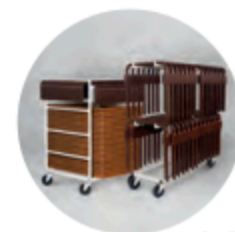
chariot TD2 p.15