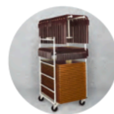
Chariot TD1 p.15