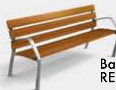
Banc en bois Neobarmino. REF. UM304N