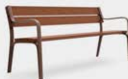
Banc en bois et fonte Citizen. REF. UM301