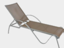
Bain de soleil Focéa. Réf. BSFCL.