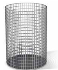
CORBEILLE MÉTALLIQUE INTÉRIEURE