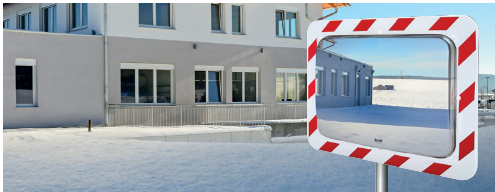
Réf. 858 AB