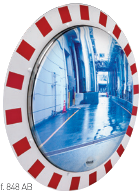
Réf. 848 AB