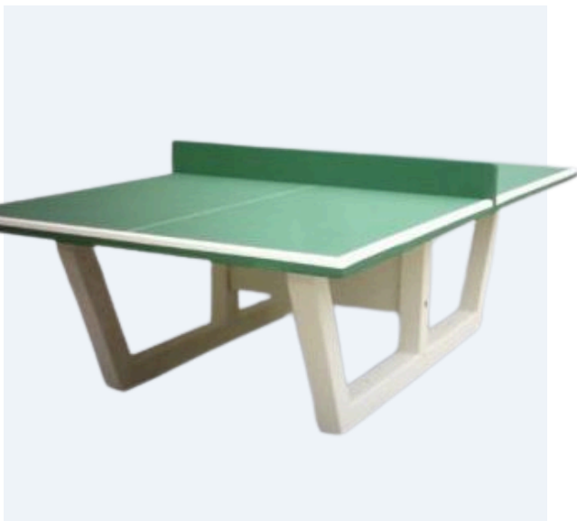
TABLE DE PING PONG BÉTON