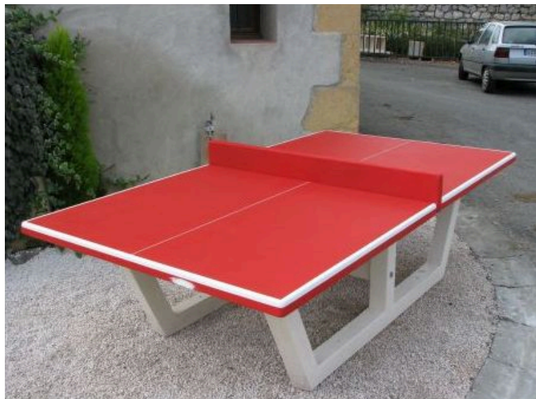
Table de ping pong en béton armé en plusieurs coloris : bleu, vert ou en option : rouge et jaune et blanc.