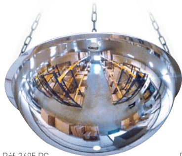
Réf. 3695 PC