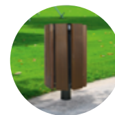
Corbeille BOTANIA p.107